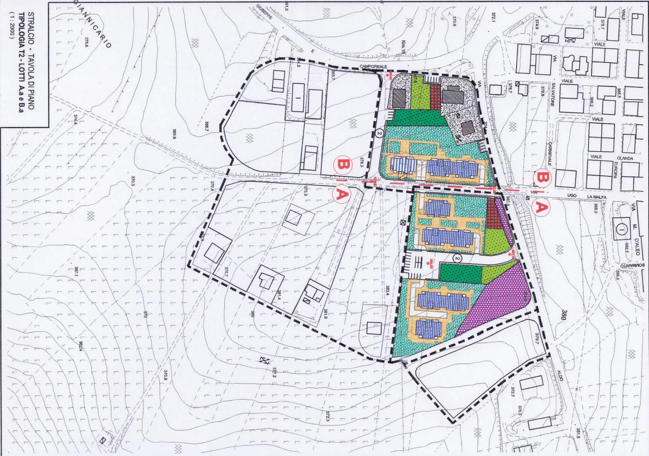
PROFilo A-A (1:200)